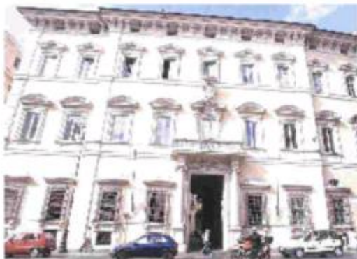
Palazzo Altieri Sede dell'Abi. Oggi si tiene la riunione di Each