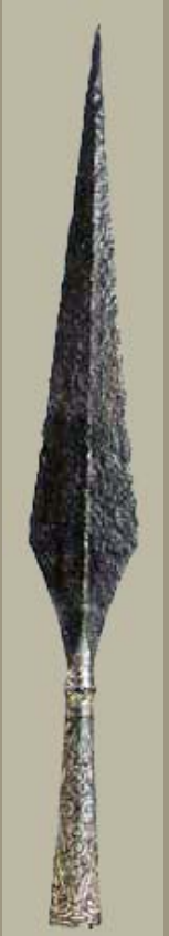
La pointe de lance