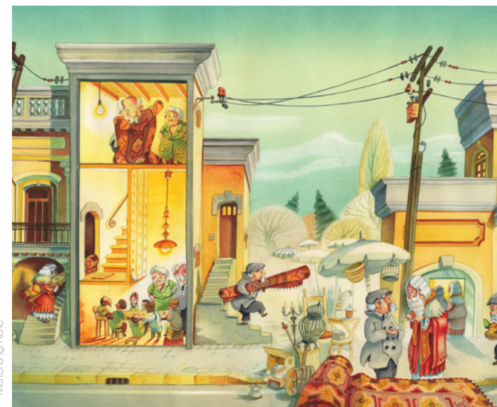
Mertens © Kerle

Het artistieke universum van Dominique Mertens komt in jeugdboeken tot leven. We vinden het ook terug in natuurmagazines en schoolboeken die het dagelijks leven van de scholieren met een vleugje poëzie willen opvrolijken. Dominique Mertens groeide op het platteland op. Hij ervaart de natuur dan ook als vertrouwd en gastvrij; het favoriete thema van zijn artistieke activiteiten. Ook de mens heeft daarin een plaats, in perfecte harmonie met zijn omgeving. In aquarellen legt hij die natuur vast. Soms geïdealiseerd, dan weer realistisch tot in de kleinste details.