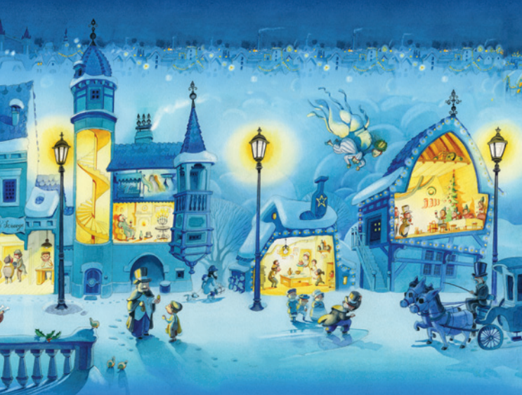
Mertens © Kerle

Réalisée avec le soutien de l'Asbl Sur la Pointe du Pinceau, cette exposition, au parfum de printemps et composée de travaux originaux, ravira tant les amateurs d'art que les enfants, mais aussi tout adulte ayant gardé précieusement dans son cœur la fraîcheur de son enfance.