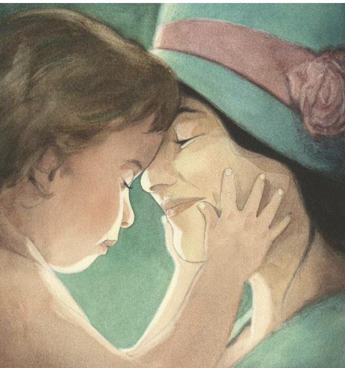
Gréban © Mijade

Deux artistes de talent formés à l'Institut Saint-Luc à Bruxelles au sein de l'atelier d'illustration dont les œuvres sont à la fois proches tout en se distinguant subtilement.