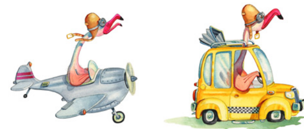
Mertens © Plantyn

et accueillante, comme sujet de prédilection pour son activité artistique. L'être humain y est aussi présent et en parfaite harmonie avec son environnement. L'aquarelle lui sert de médium afin de créer cette nature tantôt idéalisée, tantôt réaliste jusqu'aux plus petits détails.