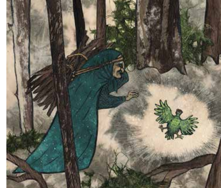
ANNE-CATHERINE DE BOEL