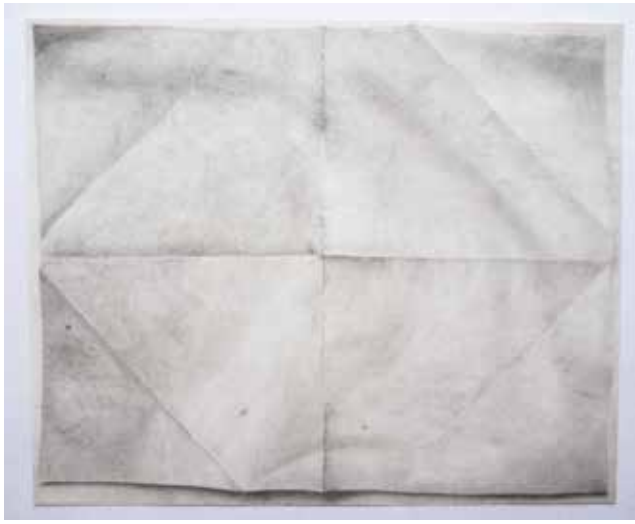
Sans titre , crayon graphite sur papier Schoellershammer, 25x31 cm, 2019