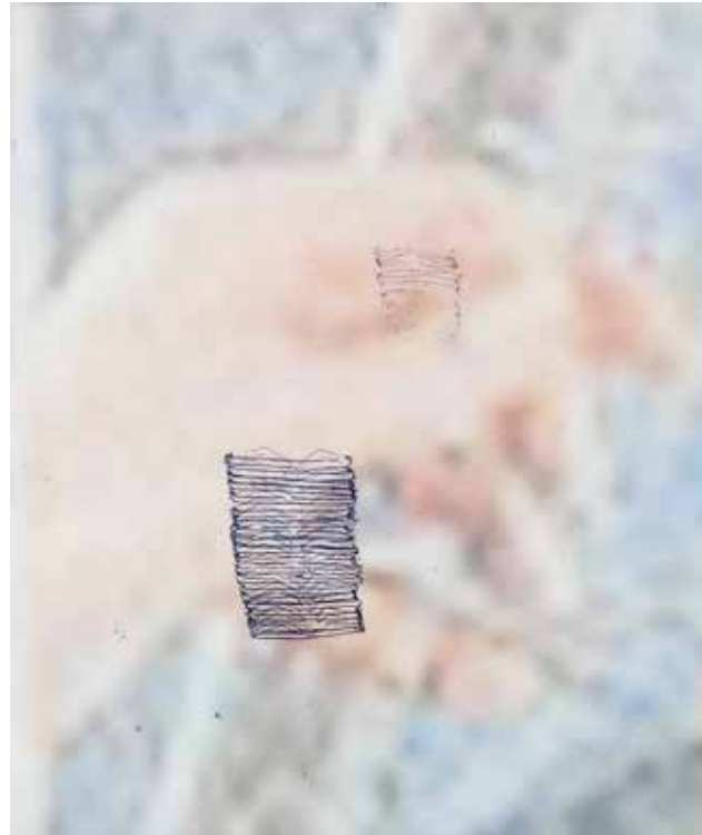
Les humains , eau-forte et chine-collé sur papier Arches BFK Rives, 91 x 63 cm, 2023