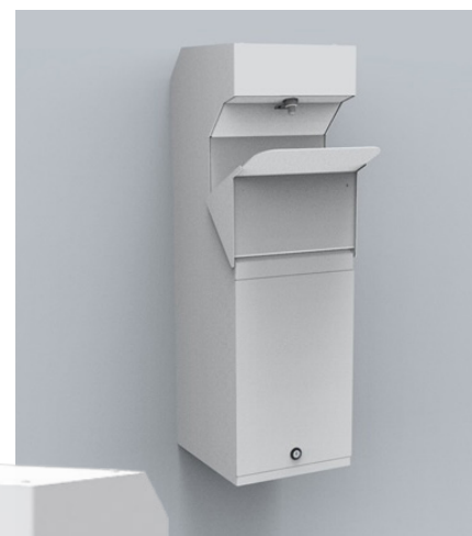
Eco v4 montage mural